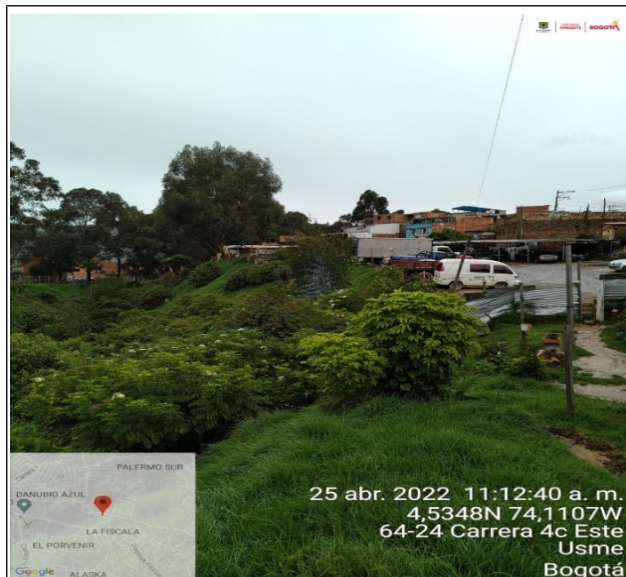
Fotografía 1. Desarrollo de actividades comerciales (Montallantas y parqueadero) sobre el Corredor Ecológico de Ronda de la Quebrada Hoya de Ramo en predio con nomenclatura urbana Calle 64 Sur 1B 41, localidad de Usme.